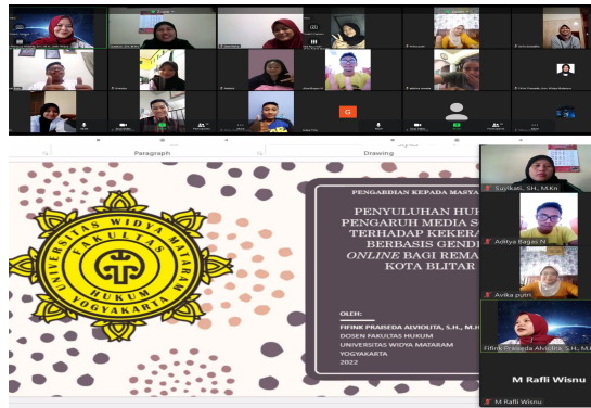
Gambar 1. Foto dengan peserta dan saat pemaparan materi