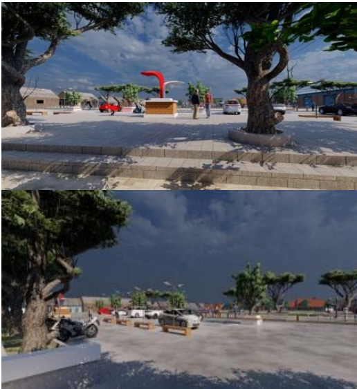
Gambar 7. Suasana Revitalisasi Fungsi Lapangan Desa Masaran