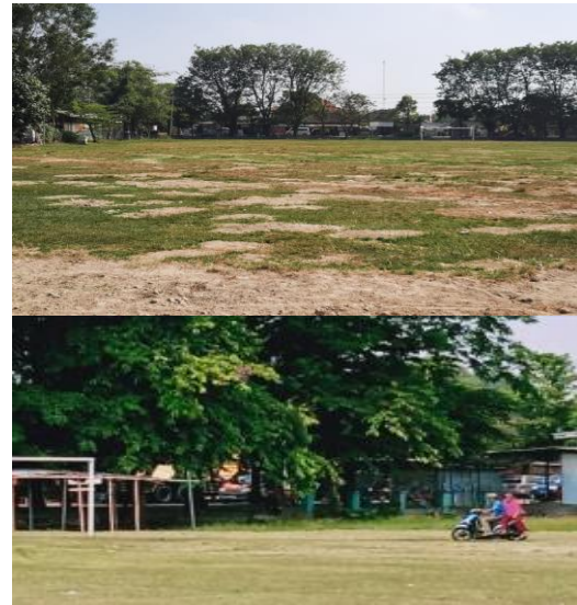
Gambar 2. Kondisi Lapangan