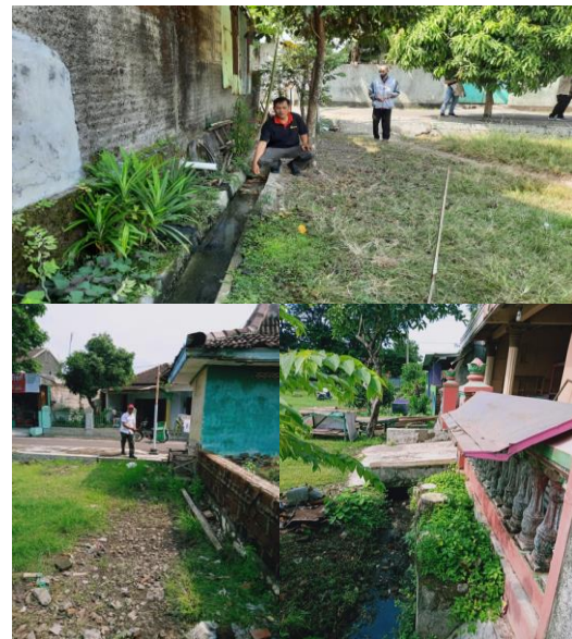
Gambar 3. Kondisi Drainase Pinggir Lapangan Belum Direncanakan