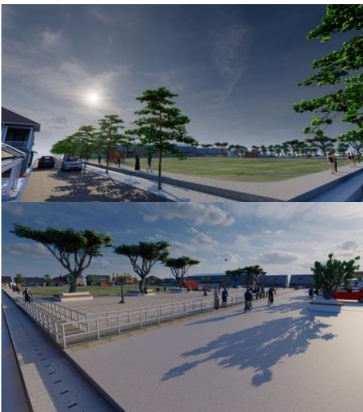
Gambar 8. Suasana Revitalisasi Fungsi Joging dan Terapi

Konsep revitalisasi lapangan desa menekankan pada fungsi lapangan, dimana fungsi lapangan yang dahulu hanya untuk bermain sepak bola, kemudian jarang digunakan. Sekarang, dengan penataan ruang luar mampu menampung beberapa aktifitas. Selain olahraga, aktifitas berkumpul ( refreshing ), space untuk pedagang keliling dengan sepeda motor diberikan lokasi. Terdapat pula space untuk