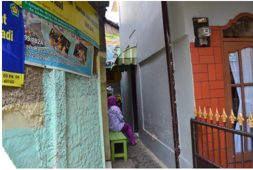
Gambar 1. Gang Menuju PAUD Kibar Auladi