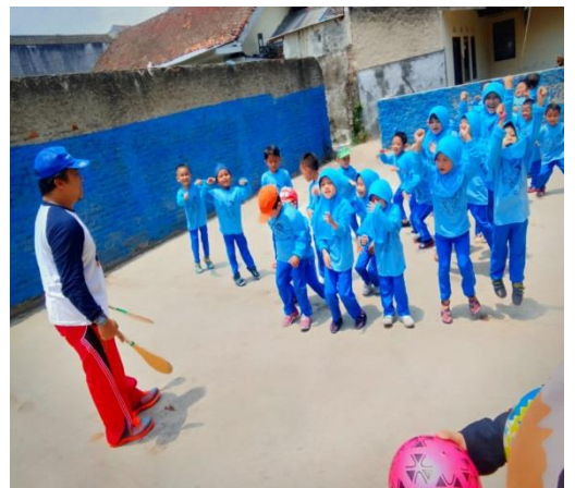
Gambar 5. Membersihkan sampah secara terampil setelah kegiatan selesai