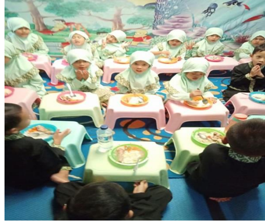
Gambar 3. Mengetahui jenis sampah melalui makanan dan minuman

Kesulitan yang dialami ketika pengabdian ini dilaksanakan yaitu sempitnya lahan belajar sehingga tim pengabdian dan guru agak kesulitan mengatur siswa ketika mengadakan pelatihan kebersihan dengan cara bermain. Alternatif mengatasi kesulitan ini yaitu dengan cara mengajak siswa belajar dan bermain di lapangan yang berjarak sekitar 1 km dari sekolahnya. (gambar 3, 4 dan 5)