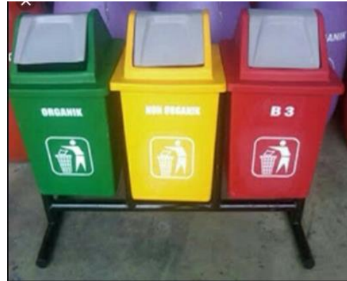
Gambar 2. Tong Sampah Terpilah