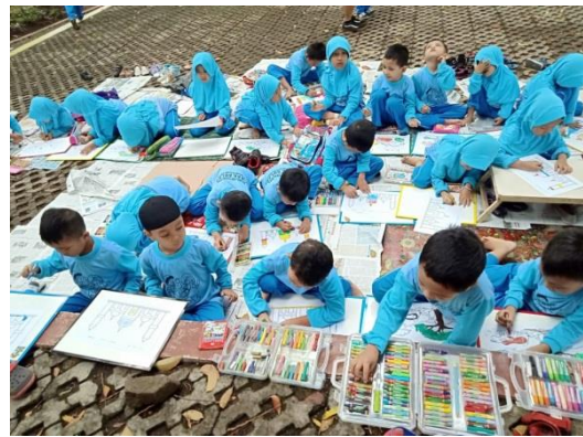
Gambar 4. Mengetahui jenis sampah melalui gambar dan kegiatan mewarnai